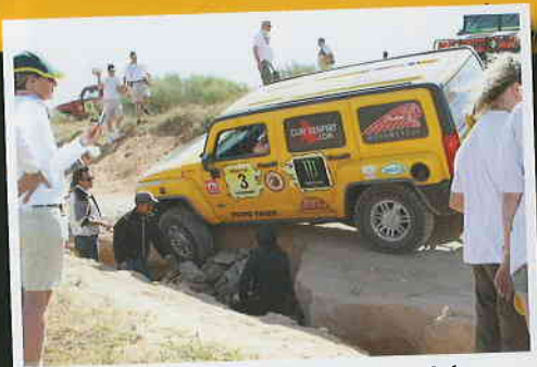
HUMMER DESERT STORM