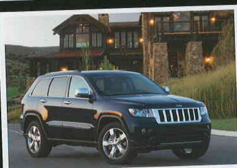
NEW GRAND CHEROKEE