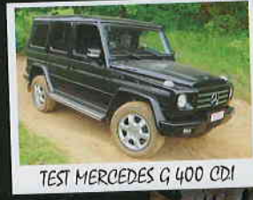
TEST MERCEDES G 400 CDI