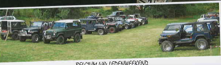
BELGIUM 4X4 LEDENWEEKEND